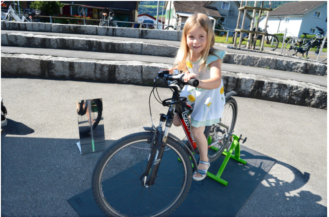
Mit Strampeln auf dem Fahrrad konnte Energie erzeugt werden.

gietage bei Gemeinden eingesetzt werden.