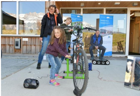
Velo-Generator auf dem Energietag Gamprin Bendorf am 23.03.2019 begeistert Jung und Alt.