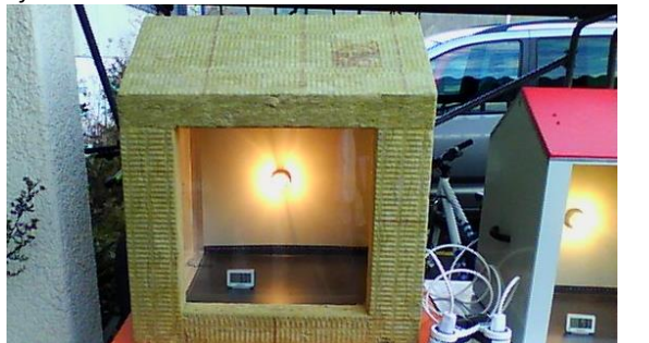
Energieunterricht Scuola Vivante Buchs. Ein gedämmtes Haus verspricht mehr Komfort.