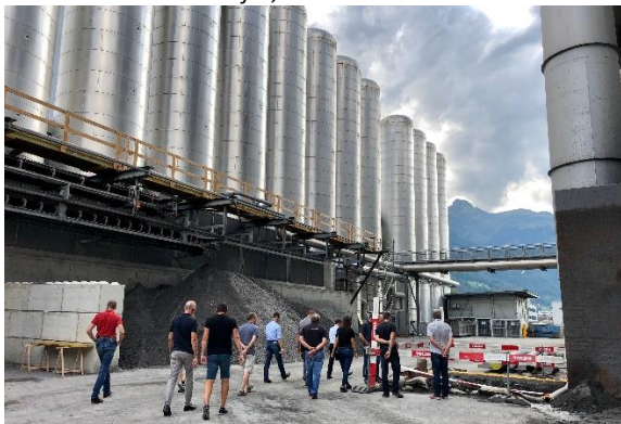
Führung durch die KVA Buchs am 23.08.2018.