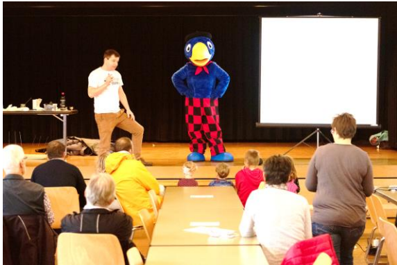
Eröffnung der Energiewerkstatt Grabs am Energy Day 27.10.2018 mit Stargast Globi.