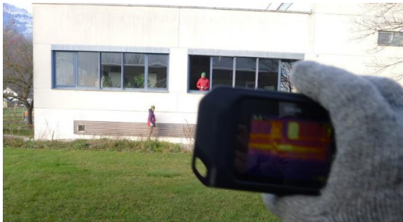
Energieunterricht Scuola Vivante Buchs sorgt für Aha's, das Schulhaus ist nicht effizient.