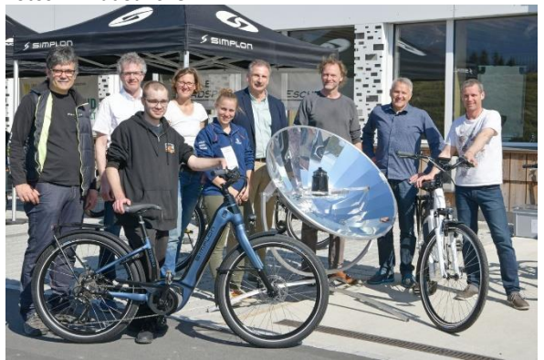
Solkocher auf dem Energietag Gamprin Bendorf am 23.03.2019 sorgt auch für Aufmerksamkeit.